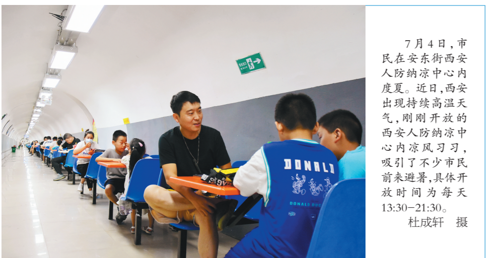
7月4日,市民在安东街西安人防纳凉中心内度夏。近日,西安出现持续高温天气,刚刚开放的西安人防纳凉中心内凉风习习,吸引了不少市民前来避暑,具体开放时间为每天13:30—21:30。

构件车间产品主要包含市政排水管、预制管廊、双T板、预制柱、叠合板、NPC方涵、剪力墙等各类建筑部件及装饰构件,年设计产能3万立方米。