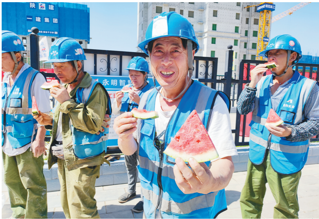
7月4日,陕建一建集团第二公司组织青年志愿者服务队带着防暑降温品,来到西安的部分项目施工一线,把清凉与关怀送到每一个建设者的心坎上。

希望市民朋友一定要严格按照《公民防疫基本行为准则》要求,积极配合落实各项防控措施,大家共同努力,尽早扑灭疫情,恢复正常生活秩序。