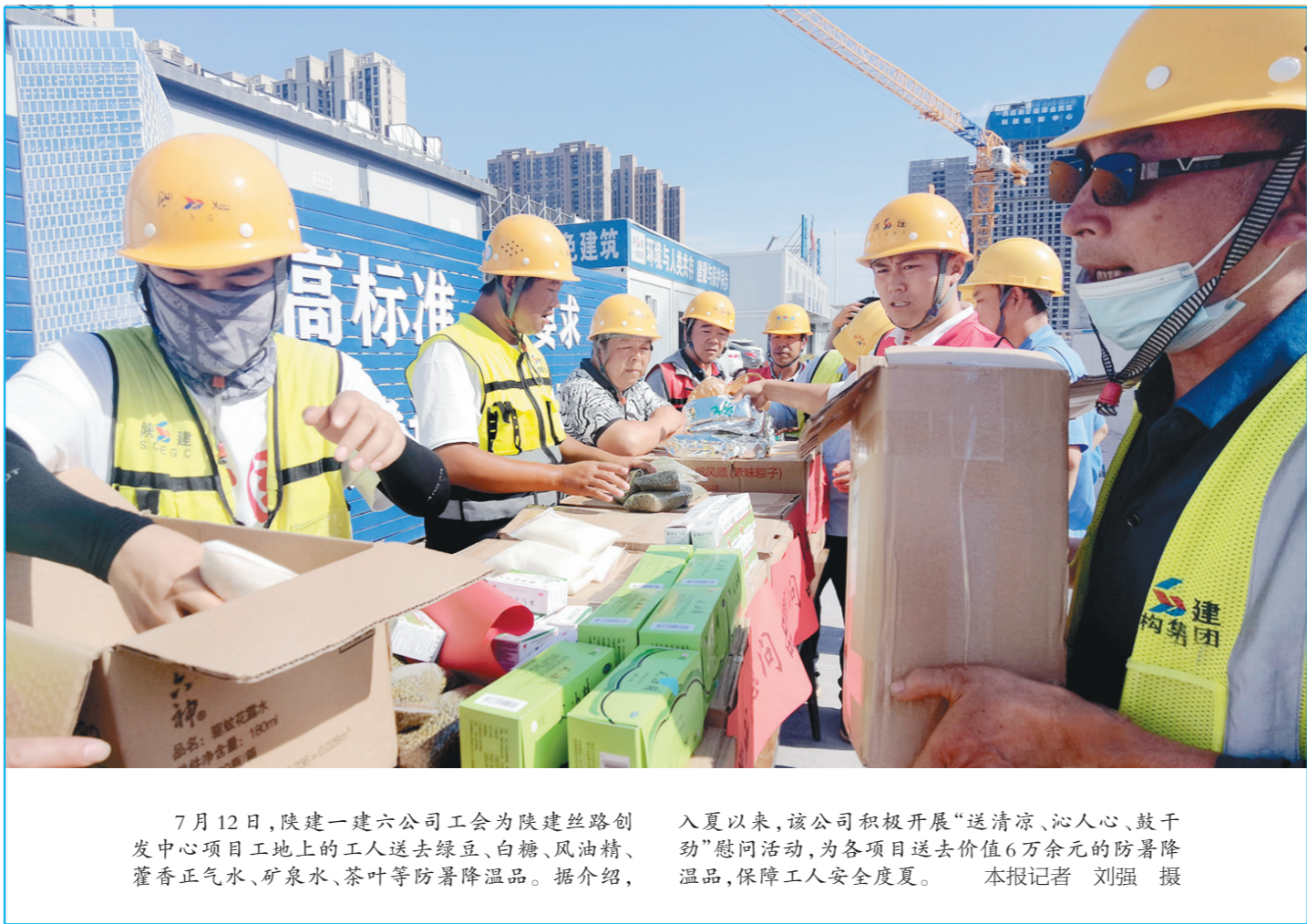
7月12日,陕建一建六公司工会为陕建丝路开发中心项目工地上的工人送去绿豆、白糖、风油精、藿香正气水、矿泉水、茶叶等防暑降温品。据介绍,入夏以来,该公司积极开展“送清凉、沁人心、鼓干劲”慰问活动,为各项目送去价值6万余元的防暑降温品,保障工人安全度夏。

西安市城六区考生普通高中统一填报的志愿分两个批次:第一批次为3所省级示范高中或市级特色示范高中志愿;第二批次为4所省级标准化高中和普通高中志愿。每个考生第一批次须至少填报2所省级示范高中或市级特色示范高中,第二批次须至少填报2所省级标准化高中和普通高中,方能提交志愿。