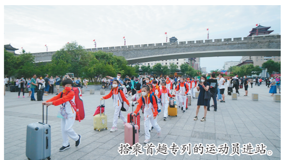
搭乘首趟专列的运动员进站。

下一步,国铁西安局将根据参赛队需求,按照“一日一图”“一车一案”原则,合理调整运力,做好省十七运的运力保障工作。