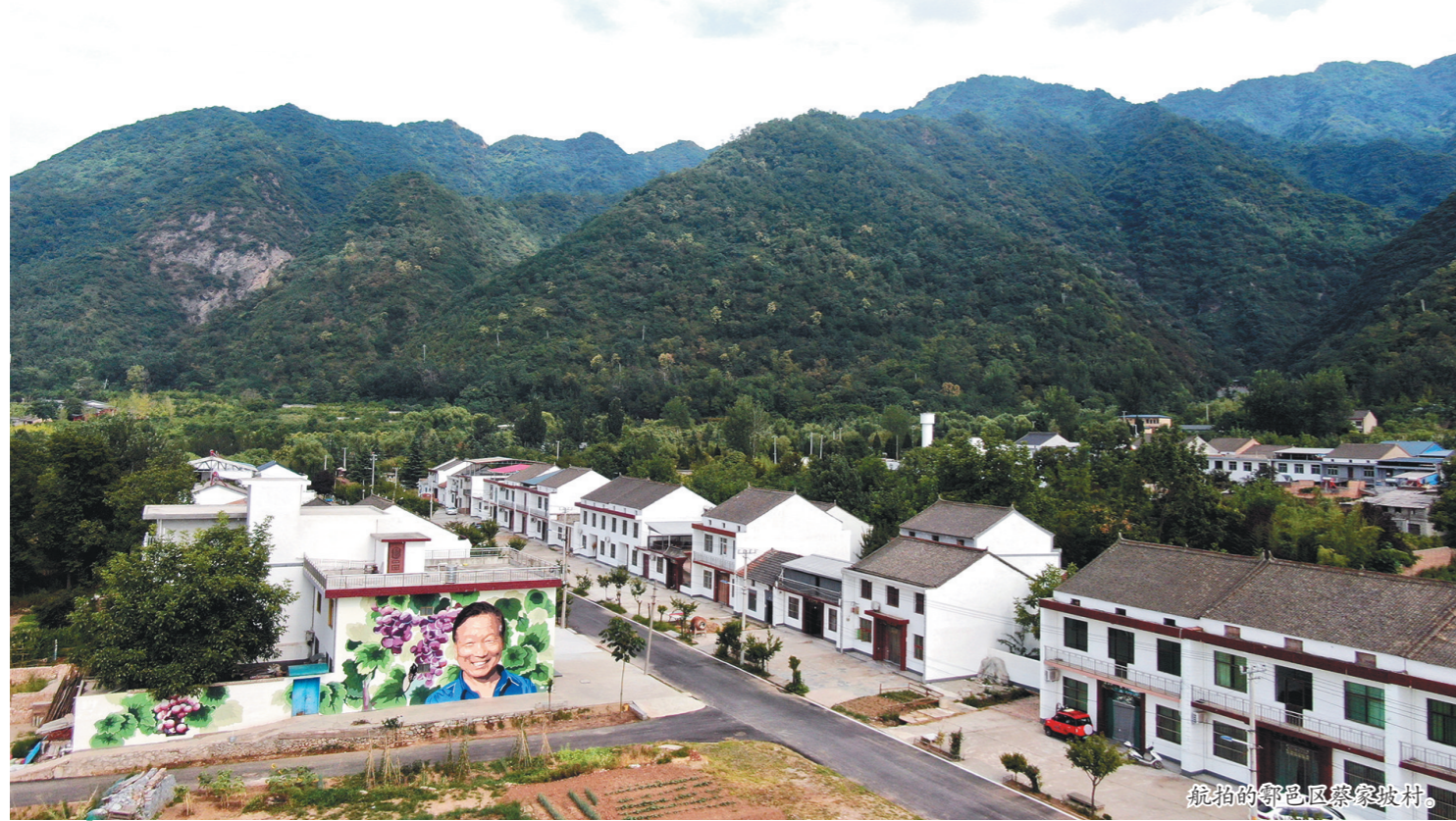
航拍鄠邑区蔡家坡村。

近年来,在西安市鄠邑区蔡家坡村等地,西安美术学院师生和广大文艺工作者致力于乡村文化再建。借助秦岭终南山丰富的自然与历史资源,将乡土变为艺术空间,将田野化为展演现场,通过打造“美好乡村计