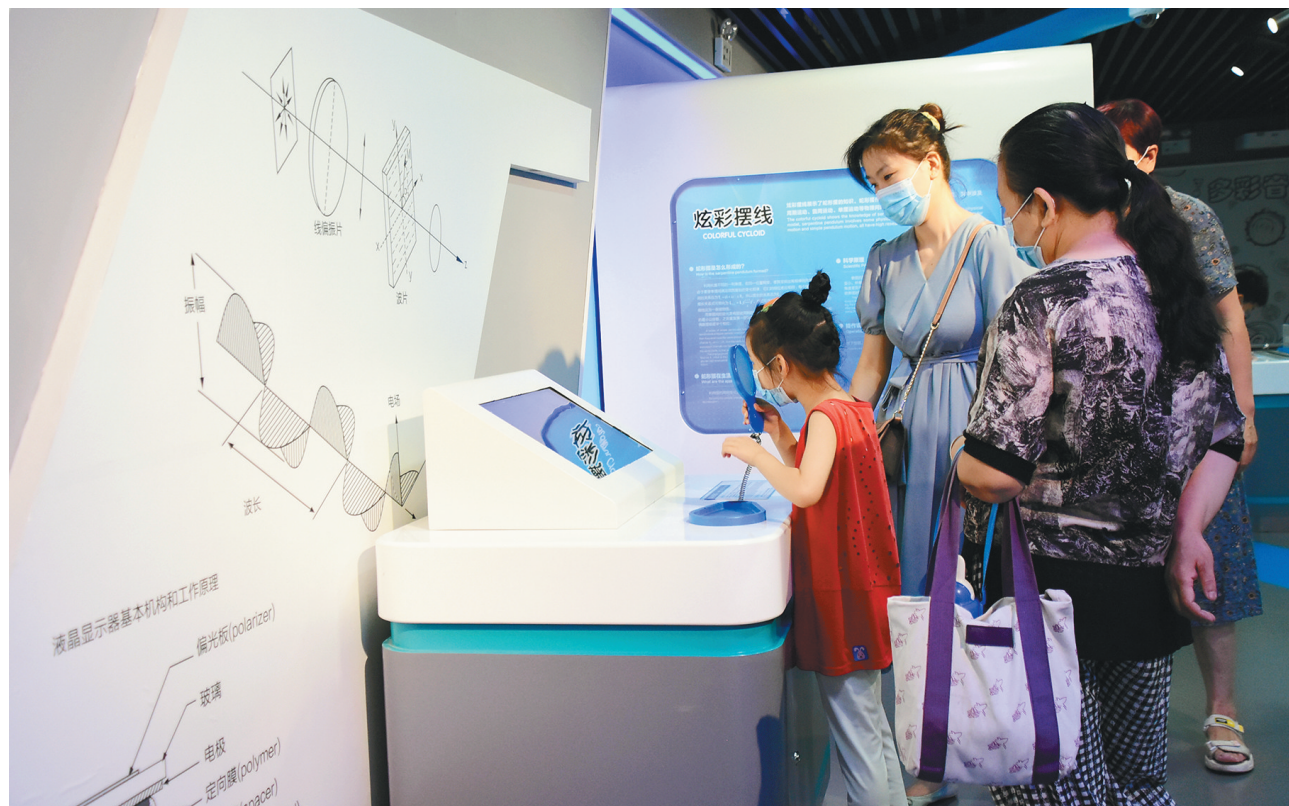
7月15日,孩子们在陕西科技馆科普互动区内参观、体验。暑期来临,陕西科技馆开展“欢乐暑假 放飞梦想 畅游科技馆”主题科普活动,孩子们通过动手实验学习科学知识,享受知识带来的快乐。

但婚礼现场未必按照从业者预设的路径发展,婚闹者“捉弄”的尺度也很难把握。职业伴娘必须考虑如何避免“闹伴娘”陋习侵害自身权益。中国传统文化促进会婚庆发展委员会会长表示,职业伴郎伴郎的服务预计年增长将会达到25%-30%。新兴职业规模变大,也要防范职业风险隐患,促进行业规范化发展。(维展)