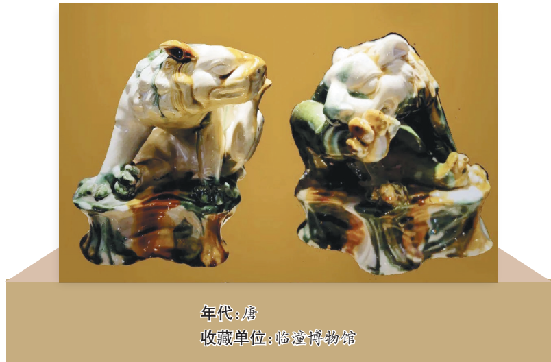
年代:唐 收藏单位:临潼博物馆