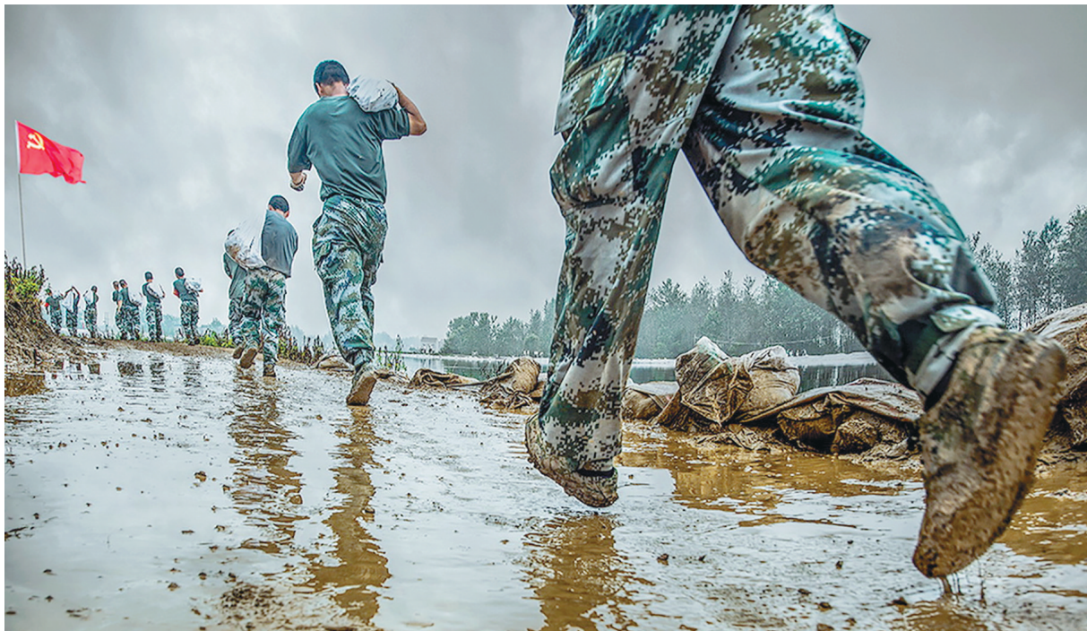
责任重于泰山

又逢八一,往事如歌。三十年前,我们在最美的年华相遇,在青春的懵懂中相知,又在匆匆中拥抱作别,把青春的背影留在彼此的记忆里;今天,我们似乎已经走得很远,又好像从未离开,恰似记忆深处远方清晨中的悠悠哨声,不管我们走多远,我们彼此心里都一直惦念。亲爱的战友,你们现在还好吗?