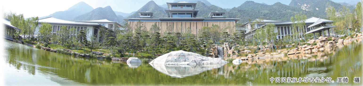
中国国家版本馆西安分馆。

西安国家版本馆中国版本馆西安分馆位于南郊秦岭北麓渭川，由著名建筑大师张锦秋设计，依山而建，以“山水相融、天人合一、汉唐气象、中国精神”为设计指导思想，总体格局力求方正、大气、典雅，并利用山峦地势起伏，形成中心对称、园林交错的建筑景观。