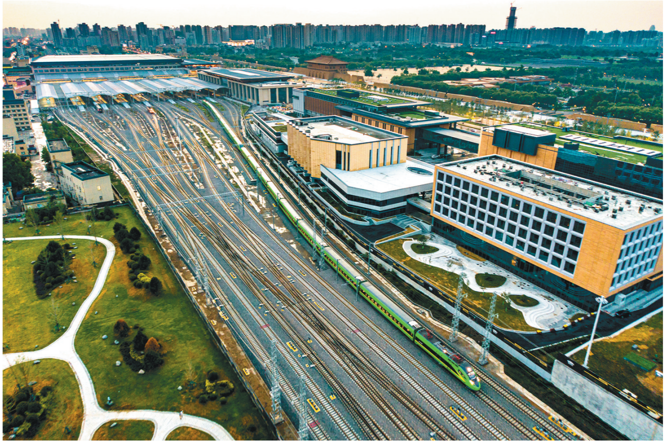
8月4日,一趟动力集中动车组从西安火车站驶出。近期全省大部分地区出现暴雨、大风天气,国铁西安局充分利用好防洪安全信息资源,制定针对性补强措施,并动态调整运输组织,优化高铁、动车组和普速旅客列车开行方式,服务好旅客暑期出行。刘翔 摄

当药企的生产积极性上来了,就可能主动承担起更大责任。药企可对自身药品的市场需求与存量进行动态监测,一旦发现存在短缺的可能,就迅速采取行动。此外,若发现全域寻药针对的是自家药品,可主动与患者进行联系,以缓解患者的寻药之苦。药企的市场监测更具有超前性,药企对缺货患者的事后补救也更直接快速,药企将自身责任向前和向后延伸,短缺药品保供就会具备更坚实的基础。(罗志华)