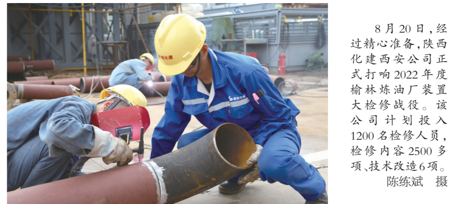
8月20日,经过精心准备,陕西化建西安公司正式打响2022年度榆林炼油厂装置大修战役。该公司计划投入1200名检修人员,检修内容2500多项,技术改造6项。

臭氧成为影响空气质量的重要因素,臭氧污染防治成为环境空气质量热点需求。臭氧污染机理复杂且我省尚未全面开展本地化的臭氧污染机理研究,难以制定有针对性的臭氧污染防治措施。