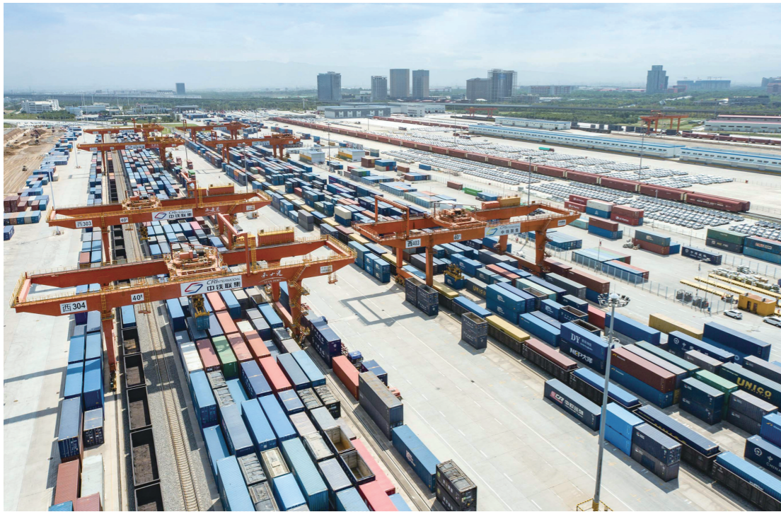
西安国际港站,国际货运班列装卸作业正在紧张进行。

随着中欧班列(西安—汉堡)21日从西安国际港站开出,今年以来中欧班列累计开行达10000列,较去年提前10天破万列;今年累计发送货物97.2万标箱,同比增长5%,