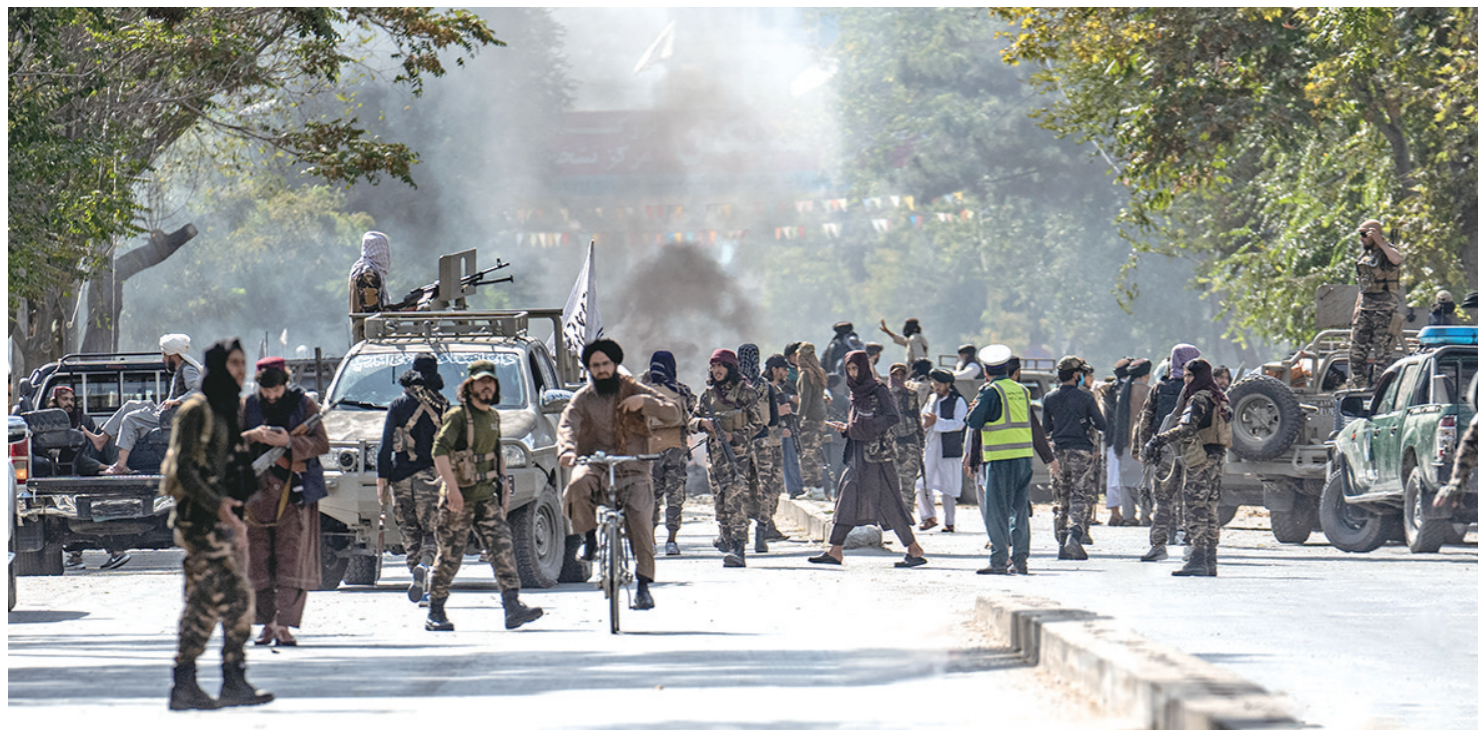
9月23日,在阿富汗首都喀布尔,塔利班人员在爆炸现场附近警戒。阿富汗警方23日说,该国首都喀布尔一座清真寺当天发生一起爆炸事件,造成7人死亡,41人受伤。