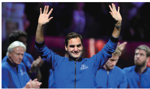
9月24日凌晨,罗杰·费德勒在赛后告别仪式上向观众致意。9月23日晚,瑞士网球选手费德勒在伦敦举行的拉沃尔杯网球赛上完成职业生涯最后一场比赛后,正式退役。