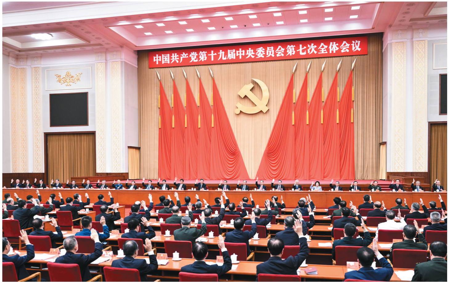
中国共产党第十九届中央委员会第七次全体会议,于2022年10月9日至12日在北京举行。中央政治局主持会议。