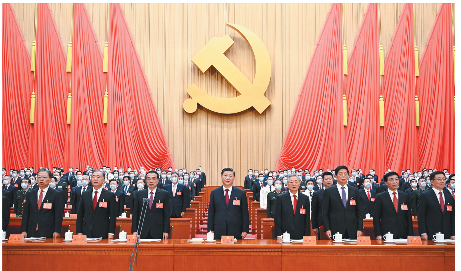
10月16日，中国共产党第二十次全国代表大会在北京人民大会堂开幕。这是习近平、李克强、栗战书、汪洋、王沪宁、赵乐际、韩正、胡锦涛在主席台上。

新华社北京10月16日电 凝心聚力擘画复兴新蓝图，团结奋进创造历史新伟业。举世瞩目的中国共产党第二十次全国代表大会16日上午在人民大会堂开幕。