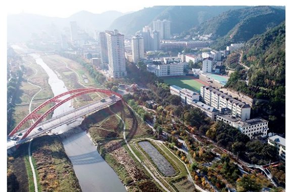
这是10月16日拍摄的延安市城区风光(无人机照片)。秋意渐浓,延安市景色宜人。

此外,陕西其他获奖的新媒体账号中,陕西省总工会获评全国网络正能量新媒体(微信组)省级工会十佳账号、全国网络正能量新媒体(其他资讯平台组)工会十佳账号,西安市总工会获评全国网络正能量新媒体(微信组)市级工会十佳账号、全国网络正能量新媒体(其他资讯平台组)工会十佳账号,陕西测绘地理信息局工会委员会获评全国网络正能量新媒体(微信组)企业/社会组织工会十佳账号。