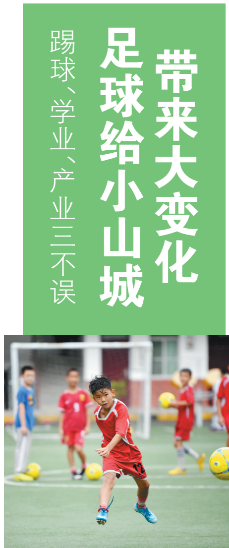
留坝县武关驿镇中心小学的小队员在各省市比赛的集训中。

目前,营盘足球训练基地正加快建设民宿、医院、酒店等配套设施,相信在不久的将来,留坝将成为国内诸多球队争相“打卡”的热门集训地。这个位居秦巴山区腹地的西北小县,也将为中国足球发展作出更大贡献。(综合《人民日报》、新华社)