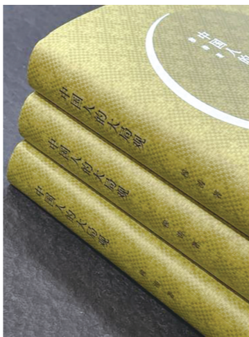
《中国人的大局观》穆涛著 陕西师范大学出版社出版

一条线、汇成一张网，进而了解历史的源流、文化的逻辑，令人有所发现和领悟，温故而知新。