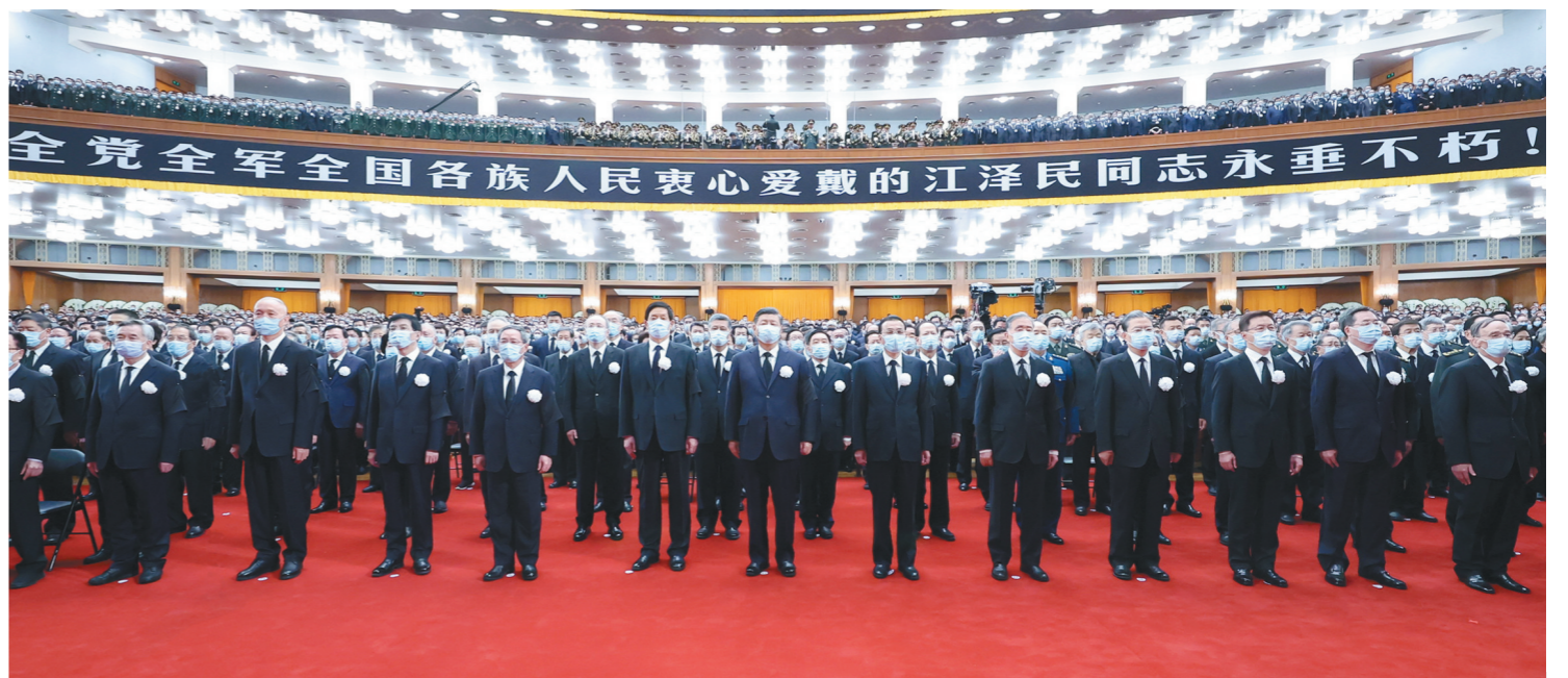
12月6日，中共中央、全国人大常委会、国务院、全国政协、中央军委在北京人民大会堂隆重举行江泽民同志追悼大会。习近平、李克强、栗战书、汪洋、李强、赵乐际、王沪宁、韩正、蔡奇、丁薛祥、李希、王岐山等参加大会。