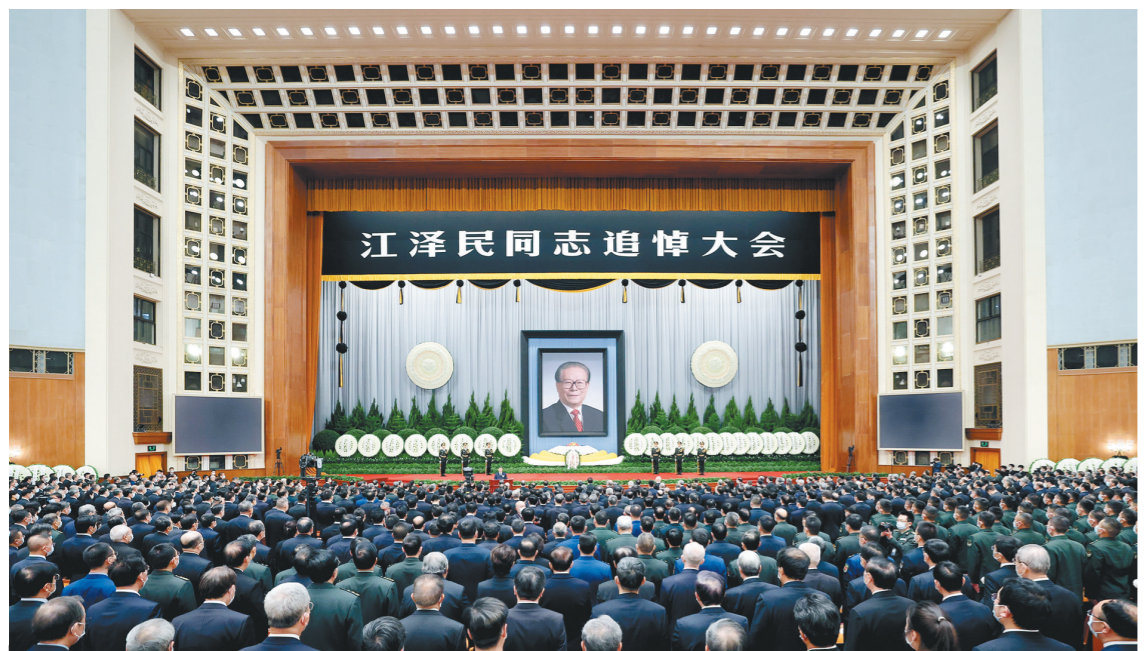
12月6日，中共中央、全国人大常委会、国务院、全国政协、中央军委在北京人民大会堂隆重举行江泽民同志追悼大会。