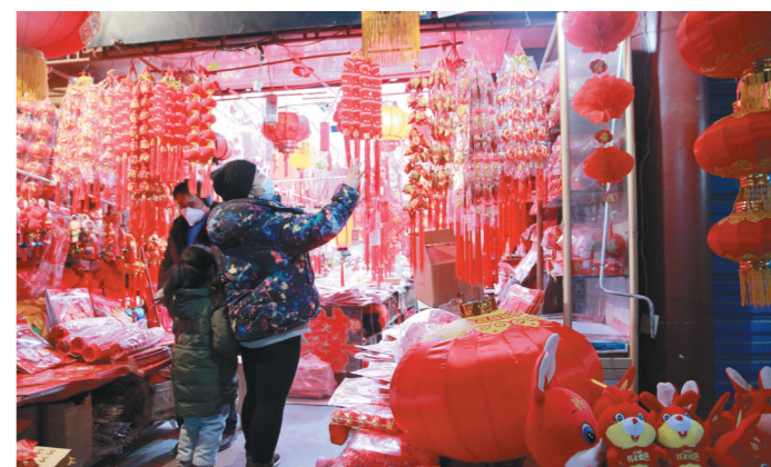
在西安城隍庙市场内,摆卖年饰的商铺又到了最忙的时候,喜庆的对联、剪纸、中国结……吸引了市民的目光。