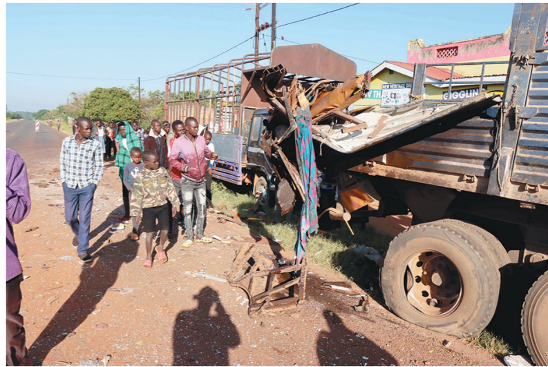
1月6日,在乌干达首都坎帕拉通往古卢的公路旁,人们查看事故现场。乌干达警方6日表示,该国北部地区当天凌晨发生一起公共汽车与卡车相撞事故,造成15人死亡。