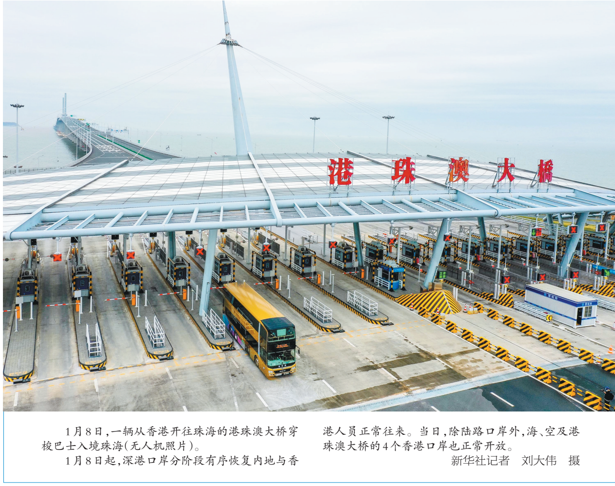
1月8日,一辆从香港开往珠海的港珠澳大桥穿梭巴士入境珠海(无人机照片)。港珠澳大桥的4个香港口岸也正常开放。 1月8日起,深港口岸分阶段有序恢复内地与香港人员正常往来。当日,除陆路口岸外,海、空及港珠澳大桥的4个香港口岸也正常开放。

本报讯(郝振虎)2022年12月30日8时44分,陕西榆林能源集团杨伙盘煤电一体化电厂项目1号机组并网发电,标志着全球首例自然通风直接空冷系统(NDC)660MW 燃煤发电机组正式进入带负荷试运行阶段,为下一步机组投入商业运行奠定了坚实基础。 据介绍,陕西榆林能源集团杨伙盘煤电一体化电厂项目是我省重点项目,也是榆林市实行高碳城市低碳发展“三转三补”补链和强链项目,项目总投资49.96亿元。该项目采用了全球首例自然通风直接空冷系统(NDC)、全球首例空冷塔采用钢管混凝土X支柱、国内首套LNG站与燃气启动锅炉一体化技术等新技术,其中NDC系统入选国家2021年度能源领域首台(套)重大技术装备项目,与同类型的间接空冷机组相比,NDC可降低厂用电率0.43%,年节约燃煤2.45万吨,减少碳排放量5.41万吨。该项目多项创新技术的成功应用,对推动火电行业绿色低碳高质量发展具有引领和示范作用。 作为陕北—湖北±800千伏特高压直流输电工程的重要配套电源点,该项目规划建设两台660MW超超临界燃煤空冷发电机组全部投产后,年发电量可达66亿千瓦时,将为北电南送和陕电外送“空中通道”提供可靠电能支撑,有效提高陕北煤炭资源的就地转化率和清洁利用率,保障华中电力供应,对建设国家级千万千瓦级煤电基地具有重要意义。