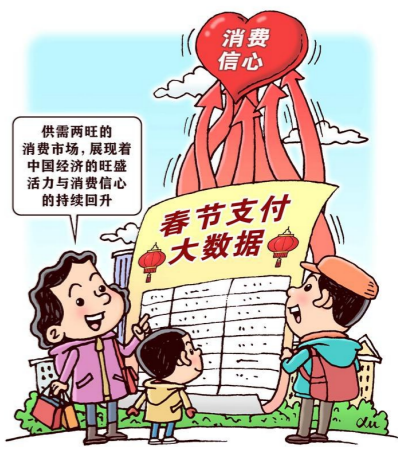
消费信心回升 新华社发 徐骏

消费是观察中国经济的晴雨表,消费数据的变化,折射着我国经济的脉动。多个部门与支付平台日前发布的数据显示,在刚刚过去的春节假期里,我国出行旅游火爆,城市商圈客流量增多,春节档掀起观影热潮……供需两旺的消费市场,展现着中国经济的旺盛活力与消费信心的持续回升。