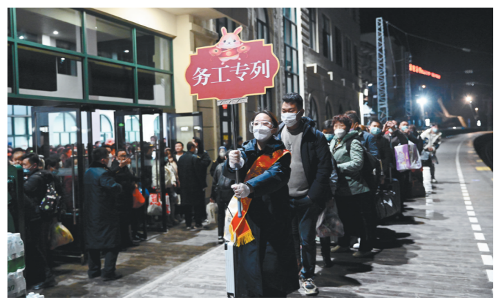
紫阳车站工作人员引导务工人员乘车。熊国栋 摄

客准备一次性口罩、消毒湿巾、应急药品、针线盒等物品;在候车室设置“再和家乡合个影”留影区,供旅客拍照留念,让务工人员感受到浓浓的家乡氛围。