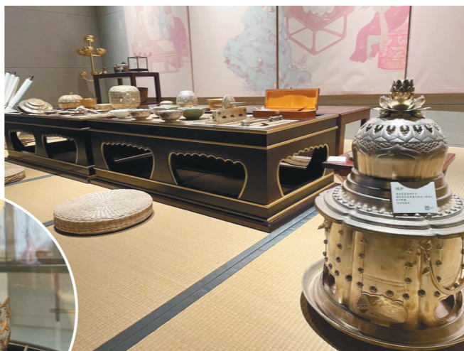
↑ 仿制的唐代茶具及达官贵人宴会使用的精美餐具。

安仁坊是唐长安城外郭城108坊之一,向北距皇城仅隔两个坊。其东边为安上门街,南邻光福坊,北邻开化坊,西边紧邻唐都长安城的南北中轴线朱雀大街。步入西安“安仁坊遗址展示馆”,地下是古人生活过的遗迹,地上是与之相对应的有关唐人衣食住行的展示,两者相互映衬,时光交错间让人们对唐朝人的生活有了更直观的感受。