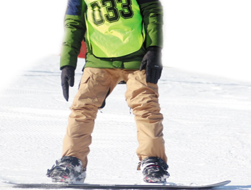
2月1日,青少年学员在学习单板滑雪。

“我们叫‘鳌山战队’,是自成立的一个滑雪组织,连续好几年了,我们的孩子们都会欢聚