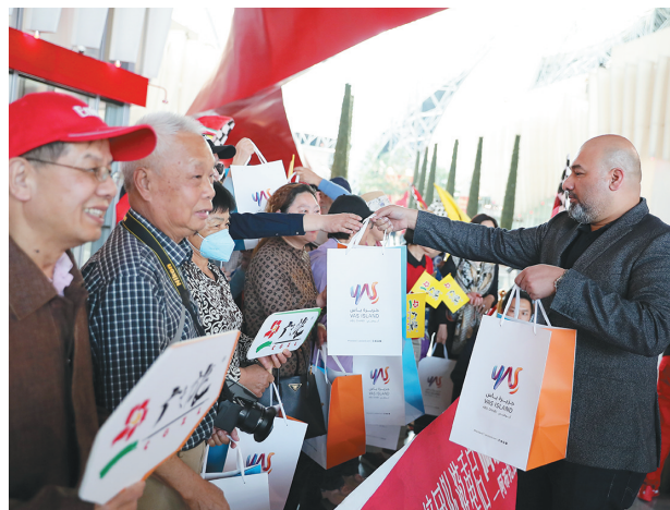
2月7日,在阿联酋首都阿布扎比的法拉利世界主题公园,工作人员向中国游客赠送纪念品。

在2019“中国-老挝旅游年”期间,超过100万中国游客到访老挝。老挝《万象时报》援引当地旅游行业专家预测报道,今年将有几百万中国游客到访东盟国家,其中许多人会选择连接中国昆明和老挝首都万象的中老铁路来开启旅程。 □苏小坡 章建华