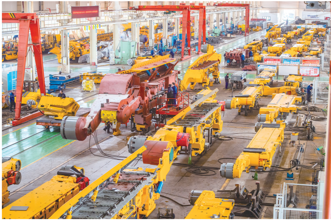
2月20日,工人在西安煤矿机械有限公司总装配分公司作业。

近年来,全省林业系统立足助力乡村振兴战略,通过实施特色经济林提质增效、培育林业龙头企业、创建林业产业示范园区等系列措施,大力推进全省林业产业发展。全省林草资源基础日益稳固,产业链、供应链、价值链加快延伸融合,产品系列化、品牌化发展提速,形成若干特色鲜明的产业集群。