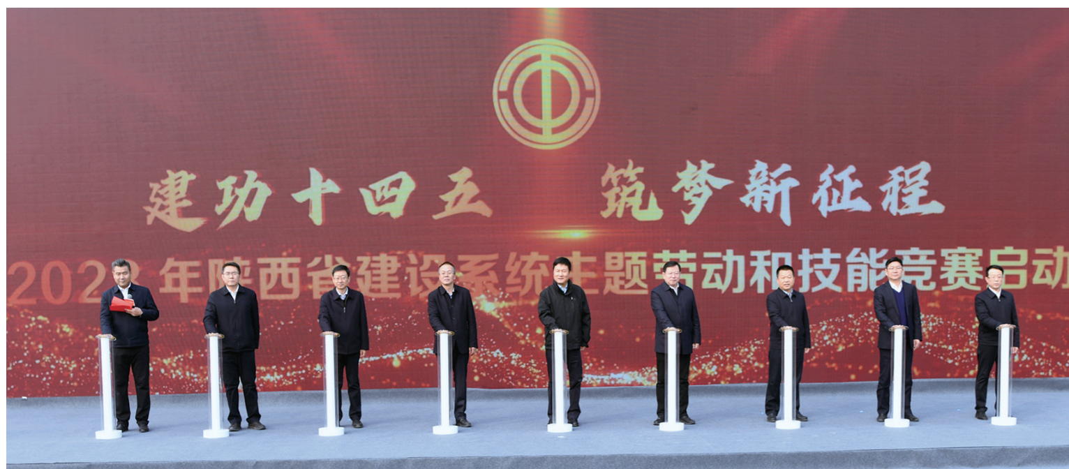
启动仪式现场。

本报讯(记者 阎瑞光)2月27日,2023年陕西省建设系统“建功十四五·筑梦新征程”主题劳动和技能竞赛启动仪式在中交二航局西安高铁东咸城市展厅EPC项目举行。省总工会党组书记、主席郭大为出席并为项目参建优秀职工代表颁发劳动证书和劳动纪念章。