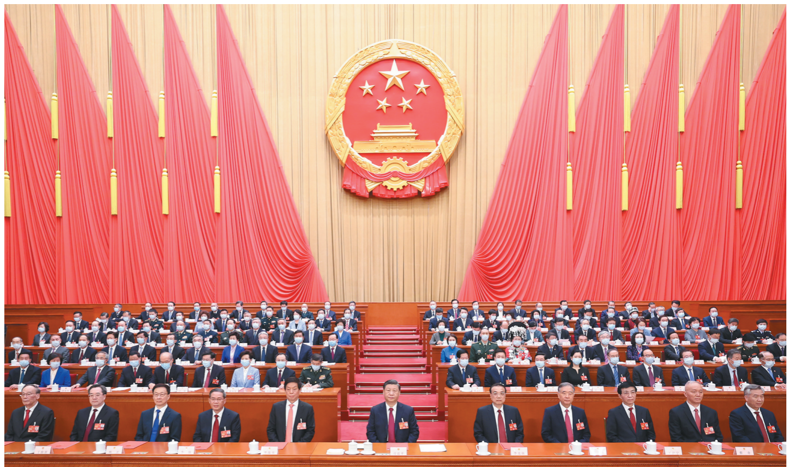
3月13日,第十四届全国人民代表大会第一次会议在北京人民大会堂闭幕。习近平等党和国家领导人在主席台就座。新华社记者 黄敬文 摄

新华社北京3月13日电 中华人民共和国第十四届全国人民代表大会第一次会议,在圆满完成各项议程,产生新一届国家机构组成人员后,13日上午在北京人民大会堂闭幕。