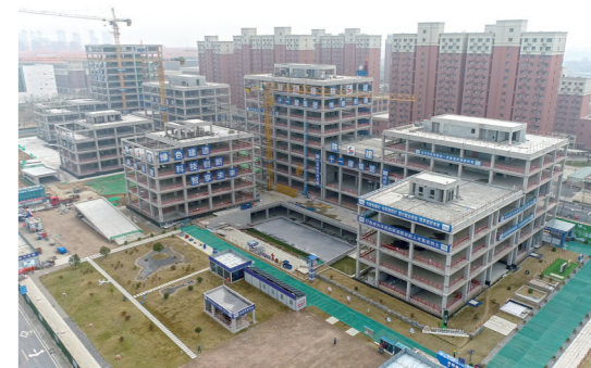
陕建十一建承建的秦创原曹家滩创新中心项目预计本月底完成二次结构施工任务,建成后可增加1000个就业岗位。

通过此次道德讲堂,广大干部职工更加坚定理想信念,不少人表示,要把“讲道德”与工作、生活结合起来,将道德模范的榜样力量转化为生动实践,为创建文明单位而努力。