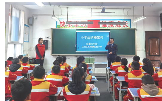
近日,安康火车站通过发放宣传资料、现场咨询等方式,开展铁路护路安全宣传工作。图为该站工作人员在学校开展宣讲活动。