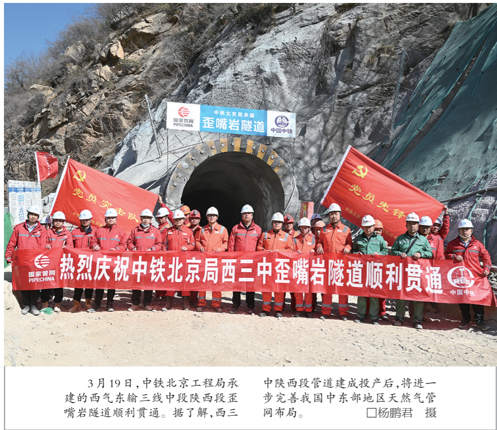
3月19日,中铁北京工程局承建的西气东输三线中段陕西段至嘴岩隧道顺利贯通。据了解,西三 陕西西段管道建成投产后,将进一步完善我国中东部地区天然气管网布局。

下一步,面对激烈的市场竞争,宝钛集团将继续加快项目建设,通过新上项目实现延链、补链、强链,加速产业转型升级,为企业高质量发展奠定坚实基础,为带动地方经济发展作出贡献。