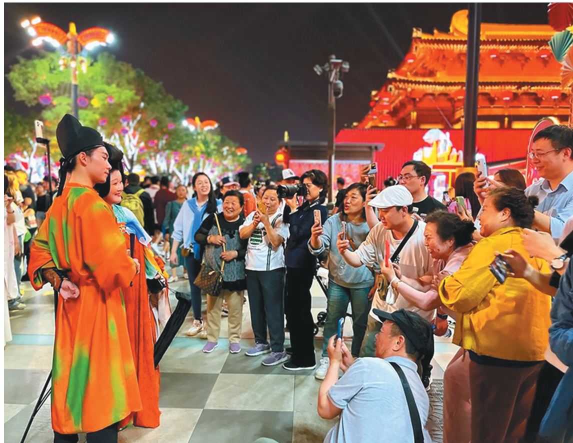
临近“五一”假期,西安大唐不夜城步行街景区游人如织。