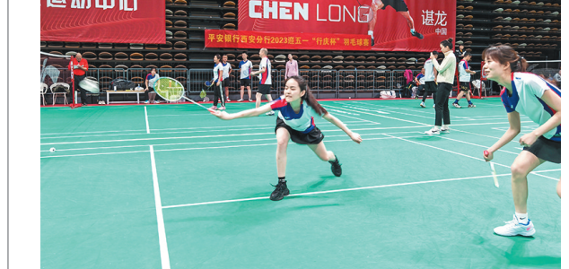
4月22日,平安银行西安分行2023迎五一“行庆杯”羽毛球赛在省体育馆举行。据介绍,此次比赛也是庆祝分行成立五十周年,让大家在忙碌之余交流感情、强健体魄。

陕西佛坪国家级自然保护区管理局宣教科科长李杰说,这只野生大熊猫戏水的地方距离保护区15公里。近年来,当地群众和游客多次在保护区边缘地带偶遇野生大熊猫,但保护区建立45年来,还是第一次在距离这么远的地方发现野生大熊猫活动。这说明大熊猫活动范围进一步扩大。