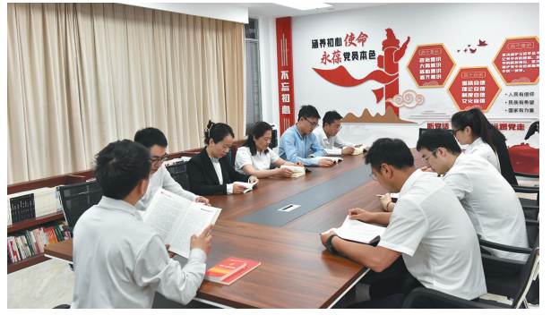
4月23日,中铁上海局七公司工会举办“人间四月天读书正当时”读书交流活动,号召广大职工多读书、读好书,提升职业能力,提高思想境界。