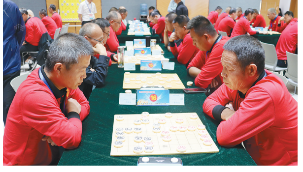
4月19日至21日,三原县总工会举办“迎五一”全县职工象棋赛,为象棋爱好者提供切磋技艺的交流平台,来自20个单位的123位选手参加了角逐。