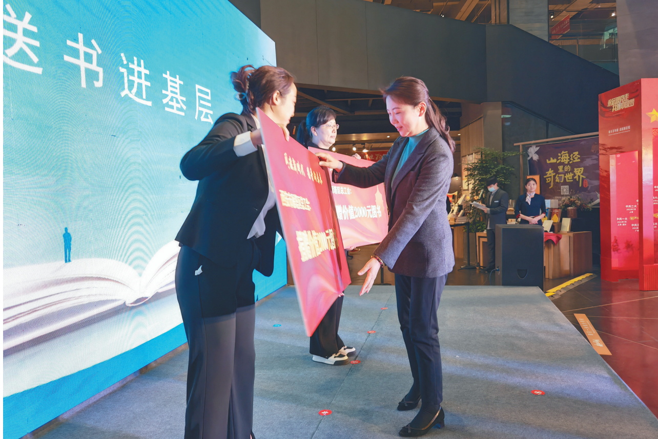
4月23日,西安雁塔区委与曲江新区工作委员会联合举办“阅读新时代·携手向未来”机关读书月活动,雁塔区总工会向大雁塔街道雁园社区和小寨路街道崇业社区职工书屋各捐赠了价值2000元的图书。据悉,雁塔区总工会已为9家职工书屋示范点累计赠送价值18000元图书。目前,全区已累计为各级职工书屋配送哲学历史、电子信息等书籍13000多册,价值50余万元。

丹凤县共有外出务工人员6.5万人,在南京市就有1万多人。“打工不易,怎么才能让大家更加放心地在外出务工?”2018年10月,在南京参加培训的贾健康坐不住了,他带领班子成员主动去南京市雨花台区总工会走访。