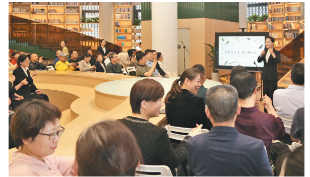
4月18日,富平县总工会开展“中国梦·劳动美——凝心铸魂跟党走,团结奋斗新征程”主题读书分享会,让悠悠书香陪伴成长。