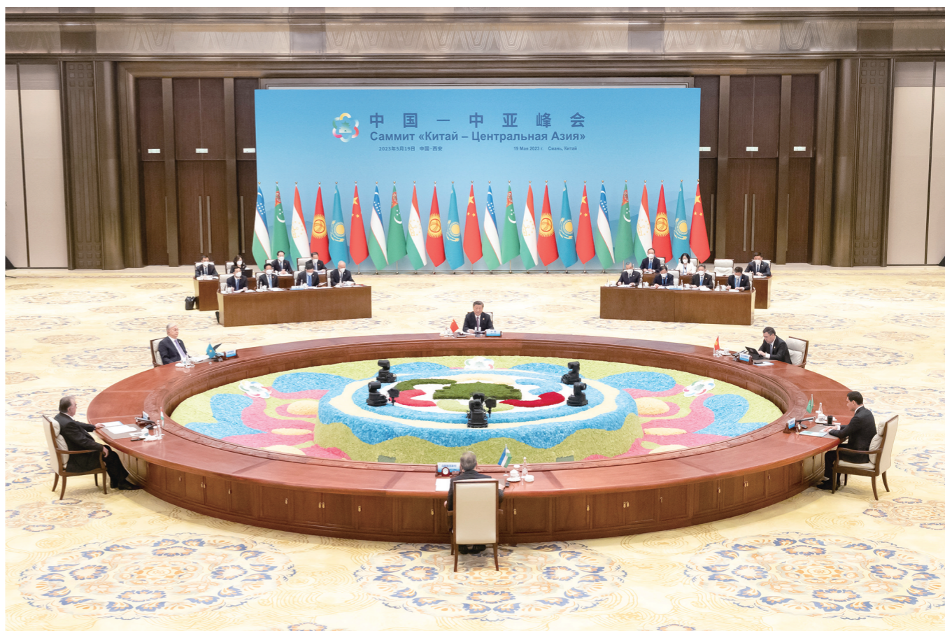
5月19日上午,国家主席习近平在陕西省西安市主持首届中国—中亚峰会并发表题为《携手建设守望相助、共同发展、普遍安全、世代友好的中国—中亚命运共同体》的主旨讲话。哈萨克斯坦总统托卡耶夫、吉尔吉斯斯坦总统扎帕罗夫、塔吉克斯坦总统拉赫蒙、土库曼斯坦总统别尔德穆哈梅多夫、乌兹别克斯坦总统米尔济约耶夫出席。