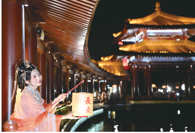
游客在西安大唐芙蓉园内游览(本月16日摄)