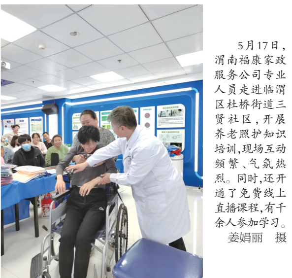
5月17日,渭南福康家政服务公司专业人员走进渭滨区杜桥街道三贤社区,开展养老照护知识培训,现场互动频繁,气氛热烈。同时,还开通了免费线上直播课程,有千余人参加学习。姜娟丽 摄

本报讯(王芳)近日,陕西庆华汽车安全系统有限公司举行2023年职工羽毛球比赛,10支代表队参加比赛。比赛以团体赛积分形式进行,分为男单、混双和男双比赛。通过比赛丰富职工文化活动,展示职工精神风貌,是落实公司一届八次职代会工作部署,增强职工凝聚力、向心力和战斗力,展示团队精神重要内容之一。