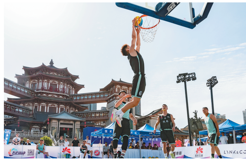
5月27日,陕西省首届“延长石油杯”三人篮球联赛在大唐西市落幕。据了解,本届比赛分为乡镇、社区、行业、青少年、俱乐部五大板块进行,共有3377支球队、19330名运动员参赛。

有些新人难以克服“入职尴尬期”,关键在于存在依赖思想,仿佛有了困难就会有老师家长帮忙,希望他人为自己纾困。与学度相比,走上职场意味着每个人都要有更强的独立意识,被动等待并不可取。职场新人应戒除“等靠要”惯性思维,遇到困难认真思考、积极沟通,主动向有经验的同事“取经”。认真完成工作之余,积极参加各类集体活动,善于发现他人身上闪光点,逐步融入职场社交圈。期待职场新人在互动交流中快速成长,在取长补短中增强本领,尽快适应职场身份,走好人生新阶段“第一步”。 (梅麟)