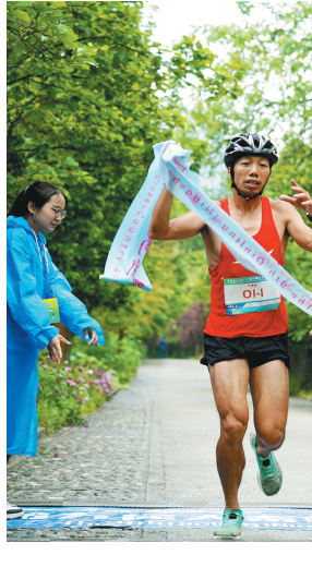
5月31日,第九届大秦岭(宁陕)山地越野挑战赛在安康市宁陕县上坝河国家森林公园落下帷幕。