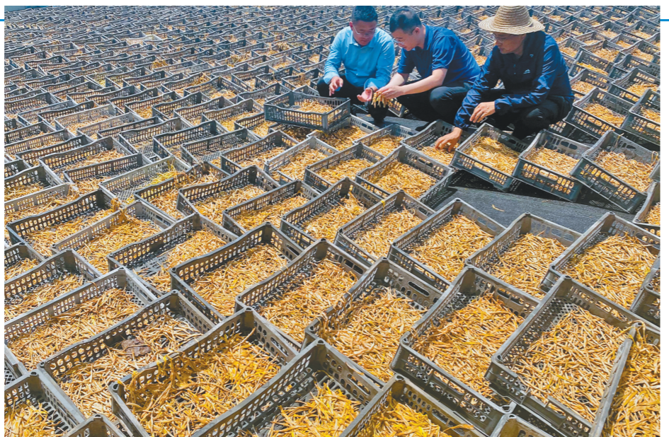
6月15日,渭南市大荔县苏村镇安监站在黄花菜加工企业检查。近期,该市黄花菜主产区苏村镇强化食品安全监管工作,通过举办质量安全培训会 and 开展设备检查等,确保食品安全。

旅游优惠范围包括商洛市境内3A级及以上收费景区。12月31日前,南京市市民凭身份证或户口本享受免门票优惠政策,持西安至商洛任意站点火车票的游客享受门票半价优惠政策,全省游客仅需100元即可购买商洛文旅惠民卡,全年不限次畅游商洛13家景