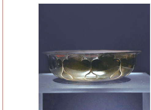
年代:唐代 出土地点:西安市南部何家村窖藏出土 收藏单位:陕西历史博物馆