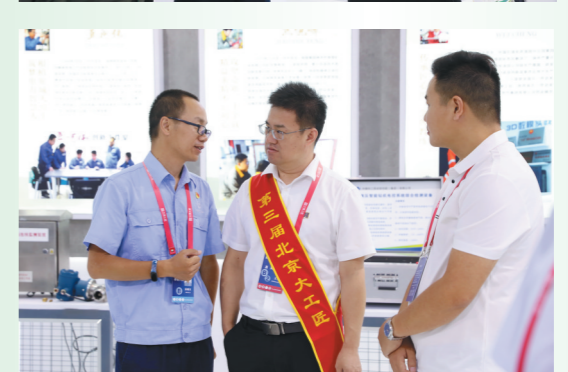
兄弟省市工匠代表来到陕西展区交流经验。