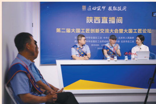
大国工匠走进直播间。