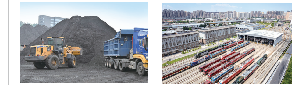
入夏以来,陕煤重庆港物流公司持续深化渝陕能源战略合作,累计发运煤炭30余万吨,有效保障了重庆地区迎峰度夏用能稳定。图为该公司煤炭装车运往各重点工业企业。

本报讯(张悦)8月1日,由中国旅游景区协会、陕西省文化和旅游厅、陕西旅游集团、延安市政府主办的红色文化旅游发展大会暨中国旅游景区协会红色文化旅游景区分会成立大会在陕旅集团金延安景区举办。 会上,来自全国的红色文化旅游专家分享了“红色文化旅游融合发展”的经验和成果,颁发了中国旅游景区协会专家委员会红色文化旅游类专家聘书。会议期间,还举行了中国旅游景区协会红色文化旅游景区分会揭牌仪式。