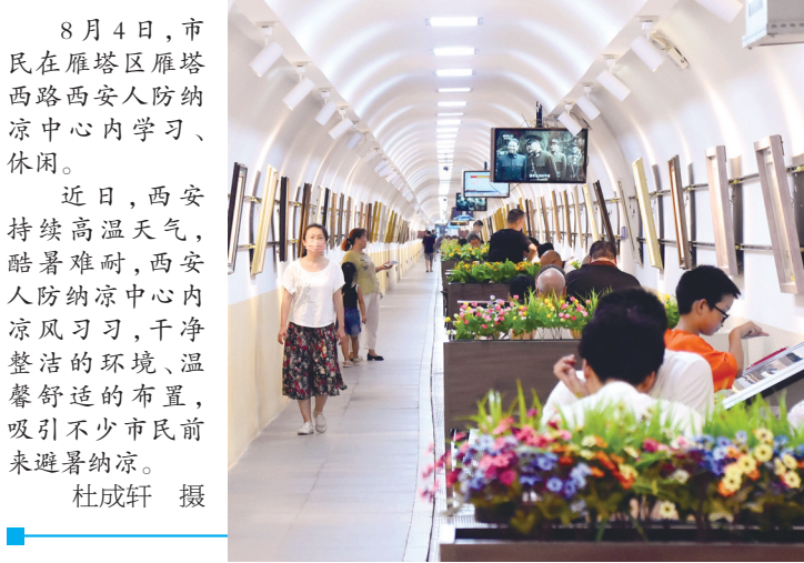
8月4日,市民在雁塔区雁塔西路西安人防纳凉中心内学习、休闲。近日,西安持续高温天气,酷暑难耐,西安人防纳凉中心内凉风习习,干净整洁的环境、温馨舒适的布置,吸引不少市民前来避暑纳凉。