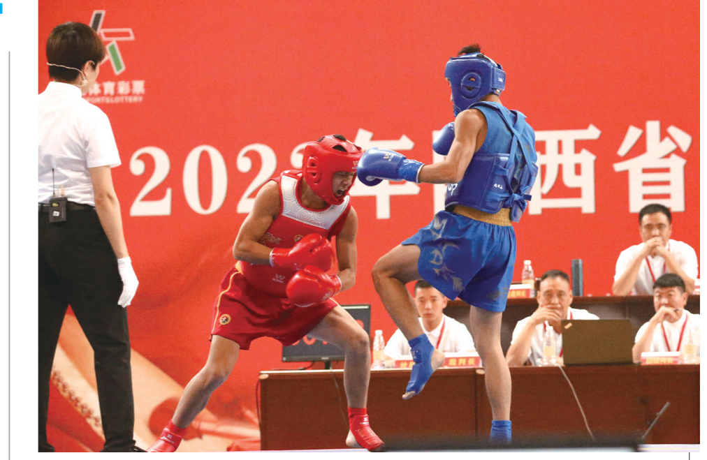
8月18日,2023年陕西省青少年武术散打锦标赛在大荔县开赛,来自全省10个市区代表队的231名运动员参加。