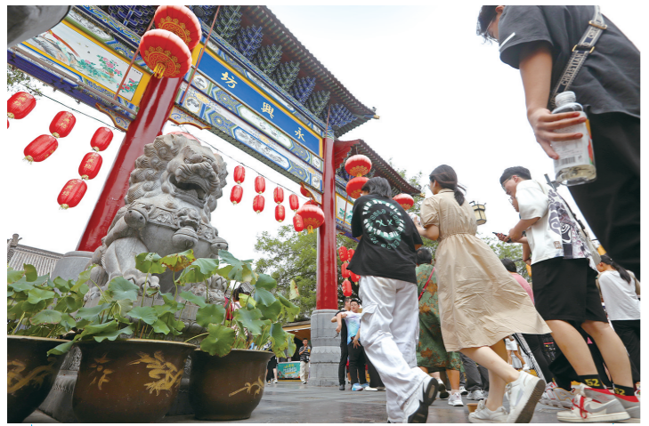
游客在西安老菜场市井文化创意街区-西安事变纪念馆-永兴坊等长度在3公里左右的城市漫步路线上游玩。

城市漫步虽具随意性,但一般有大方向上的路线规划。鲜有人知的小路、不知名的特色小店、隐匿于深处的风景,都是规划线路的加分项。数据显示,今年7月,关于“西安Citywalk”搜索量环比上涨550%。在某研究单位整理的社交媒体上最受欢迎的Citywalk城市榜单中,西安排名第六。更多“西安Citywalk”路线正逐渐被发掘,顺城路环线、书院门历史街区、老菜场市井文化创意街区等是被高频推荐的城市漫