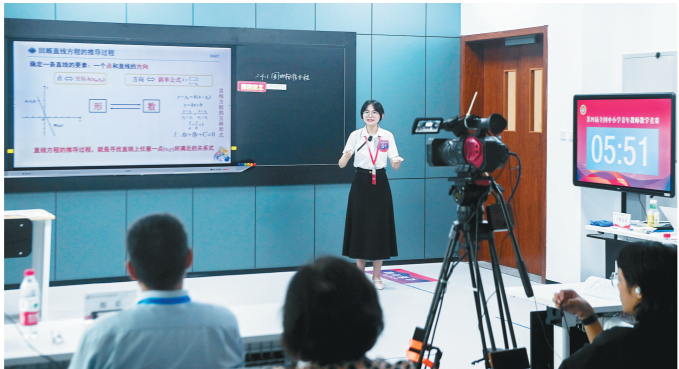
8月22日,中学数学组的一名教师在进行教学展示。当日,由中华全国总工会、教育部联合主办的第四届全国中小学青年教师教学竞赛决赛在浙江省嘉兴市嘉兴学院开