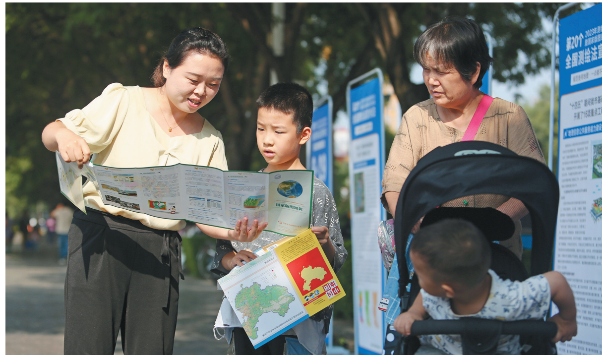
8月29日,在渭南市朝阳公园,工作人员向市民宣传测绘法。据悉,当日是第二个全国测绘法宣传日,渭南市城乡规划测绘服务中心开展宣传活动,面向市民普及测绘法,倡导公众规范使用地图、维护地理信息安全,不断提升全民国家版图意识。

“促进电子商务、直播经济、在线文娱等数字消费规范发展”“打造数字消费新业态、智能化沉浸式服务体验”……完成《措施》提出的每项要求,既需要有关部门不断加强相关法规规划建设,深化包容审慎和协同监管,健全服务标准体系,也离不开广大经营主体主动作为。如此,才能让人们消费得放心、安心、舒心,实现新型消费的稳步壮大。(年巍)