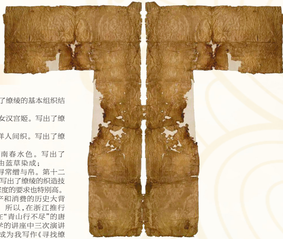
法门寺地宫出土的缵绫浴袍。

的缵绫究竟是什么?《缵绫》诗虽然只有十三行,但我却读了三十多年,也思考了三十多年。唐代缵绫在哪里?这本《寻找缵绫:白居易〈缵绫〉诗与唐代丝绸》(浙江古籍出版社出版)算是研究缵绫三十多年之后的谜底揭晓。