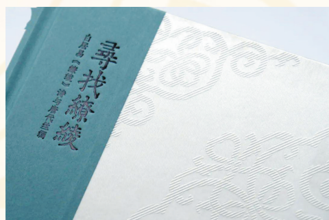
《寻找缵绫:白居易〈缵绫〉诗与唐代丝绸》

不过,缵绫研究的“全链条”是开放的。现在,我们不仅可以像唐代一样把缵绫制成浴袍,制成官服,也可以开发更多的文创产品。在《寻找缵绫:白居易〈缵绫〉诗与唐代丝绸》出版之际,我们就用缵绫面料,用蓼蓝生叶染的春水绿和靛青染的春水蓝,制成了两块大小不同的盘绶缵绫真丝方巾,也算是活化缵绫后的重要一环吧。(作者系浙江大学艺术与考古学院教授,中国丝绸博物馆名誉馆长) □据光明日报