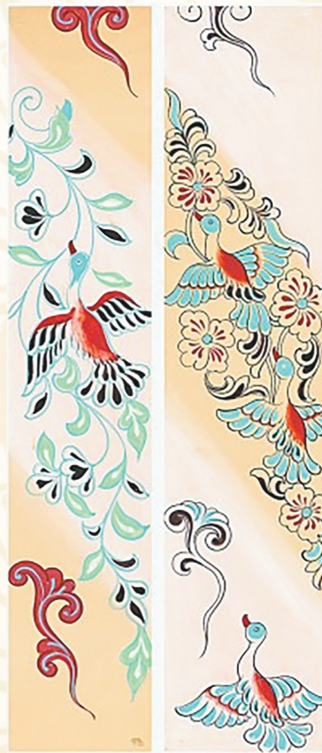
晚唐丝绸上的花鸟纹。

这样,我们把地宫出土的直领对襟团窠纹长衫(袍)(T68-D/B1-D)确定为缵绫浴袍,同时也就确定了这件上衣的面料团窠缵绫纹样为缵绫,这也正与唐穆宗长庆四年(824年)李德裕上《缵绫状》中提及的“可幅缵绫”相合。