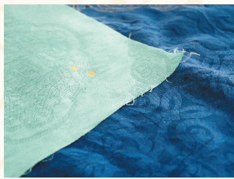
染色后的缵绫面料。