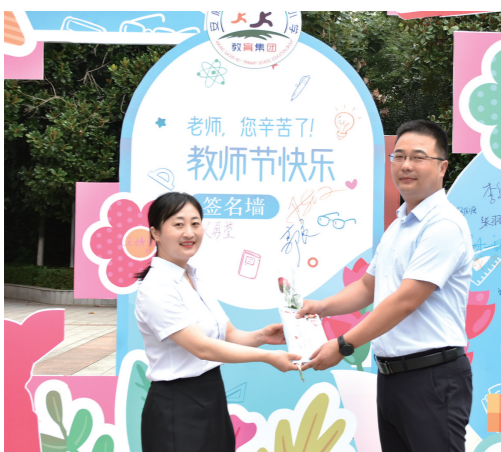
9月8日,安康高新区第一小教育集团举行庆祝教师节表彰活动,为全体教师每人送上一份特别的祝福“礼包”——一张节日贺卡、一枝鲜花和一个蛋糕,让教师们获得了满满的职业幸福感。

9月8日,陕西创建无障碍示范社区项目在西安启动。省残联相关负责人、项目领导小组成员、社区及志愿者代表100余人参加。