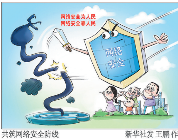
共筑网络安全防线 新华社发 王鹏作