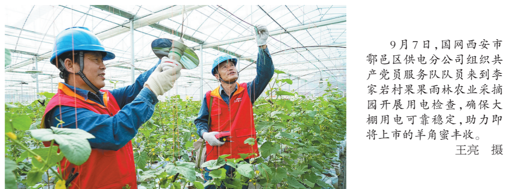
9月7日,国网西安市鄠邑区供电公司组织共产党员服务队队员来到李家岩村果雨农林农业采摘园开展用电检查,确保大棚用电可靠稳定,助力即将上市的羊角蜜丰收。王亮 摄

预案以及各种隐患排查预防等方面内容,向参训人员展开了深入讲解,并组织大家观看了叉车、触电、吊装等多个事故典型案例宣传片,让大家身临其境警示事故带来的危害性。