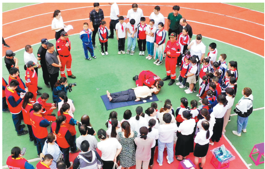
9月8日,商洛市商州区杨峪河镇小学师生在电力部门志愿者指导下,学习触电、溺水急救知识,练习心肺复苏法,进一步提升应急救援技能。刘军峰 摄

今年“一带一路”倡议提出十周年,也是“数字丝绸之路”倡议提出六周年。由大唐西市集团联合中国国家图书馆、中国文物交