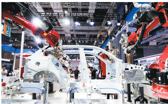
9月19日,参观者在一组进行车身焊接演示的机器人前驻足观看。当日,第二十三届中国国际工业博览会在国家会展中心(上海)开幕。本届工博会主题为“碳循新工业,数聚新经济”,展览涵盖了基础材料、基础零部件(元器件)、整机装备、整体解决方案等全产业链最新技术设备和行业发展趋势型产品。

本报讯(谢明静)近日,西安市住建局组织召开促进房地产市场平稳健康发展工作会议。会上提出,进一步优化调整限购范围,西安市二环以外区域取消限购。