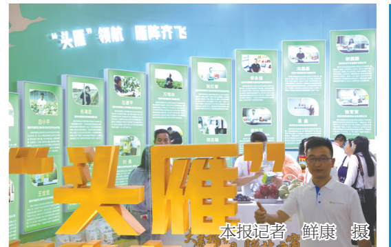
首次亮相!“头雁”闪耀

能农业与食品产业发展大会、产销对接等多场活动。 在宣传推介方面,推出了农高会宣传片、举办农高会图片展、编辑出版《农高会志》、邀请30国青年向世界直播农高会等,同时还组织开展了后稷奖评选、农科专家服务三农咨询培训,以及闭幕成果发布会等活动。 据了解,杨凌农高会创办30年来,已累计吸引来自全国34个省(区、市)以及俄罗斯、法国、荷兰、澳大利亚、新西兰、以色列等70多个国家、地区的上万家涉农企业和科教单位参展,3300多万客商和群众参展参会,参展项目及产品超过18万项,发布推出科技成果和专利12600多个,累计促成投资与交易额超过1万多亿元,获得国际展览业协会(UFI)、中国驰名商标、全国5A级农业综合展、中国农业“十大品牌展会”认证,深受广大农民、科教工作者和涉农机构、企业的喜爱,被誉为中国农业领域的“奥林匹克盛会”。