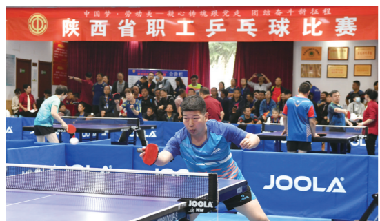
9月20日,由省总工会、省体育局主办,省职工体育协会承办的“中国梦·劳动美——凝心铸魂跟党走 团结奋斗新征程”陕西省职工乒乓球比赛在西安工人文化宫开赛。

等做了详尽回顾,并对2023欧亚经济论坛进行了概要介绍;“愿景”区域,强调了论坛的发展宗旨,描绘了论坛的未来发展方向。 有不少持续关注多届欧亚经济论坛的政商人士表示,欧亚经济论坛成果展是对历届欧亚经济论坛非凡历程、辉煌成就和宝贵经验的一次全面展示和系统回顾,昭示着区域合作发展的美好未来,在扎实助力欧亚经济论坛影响力进一步扩大的同时,还将作为“丝路精神”的宣传载体,发挥重要作用。