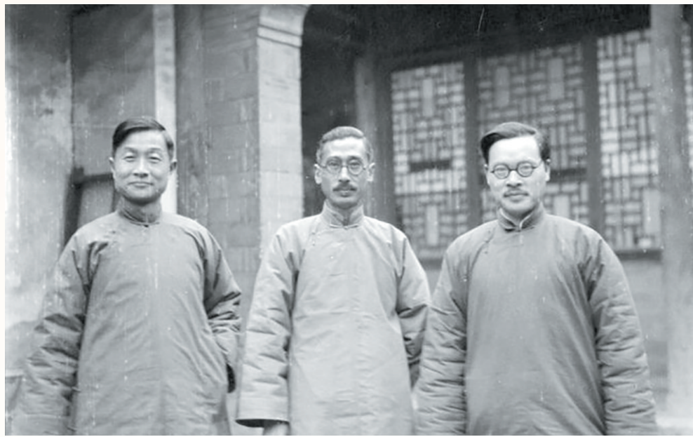
上世纪三十年代,晏阳初(左一)和同事在河北省定县(今定州市)。

晏阳初从1920年归国到1949年离开,在中国从事平民教育和乡村改造工作整整30年。彼时,国内时局动荡,军阀混战,党争激烈,经济困顿,环境艰难,但晏阳初坚守初心,矢志不渝,多次拒绝国民政府和蒋介石的任职邀请。年轻气盛的少帅张学良更是以出资八百万元大洋支持平教事业为名,并兵戎相逼强行要求其担任东北行政院长,均被晏阳初谢绝。但晏阳初自始至终热爱祖国,坚持抗日,始终对共产党十分拥戴,他和他在国领导的平民教育和乡村改造无一不镌刻着厚重的爱国情怀和红色印记。