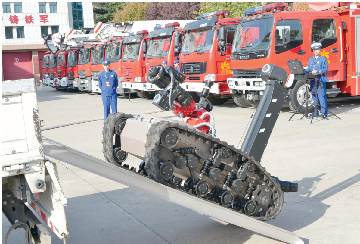
10月26日至27日,由延长石油集团公司主办、炼化公司承办的2023年度陕西省危险化学品(延长石油)应急救援队伍技能竞赛在延安炼化厂举行,来自该集团5家单位11支代表队的40余名应急救援选手参赛。