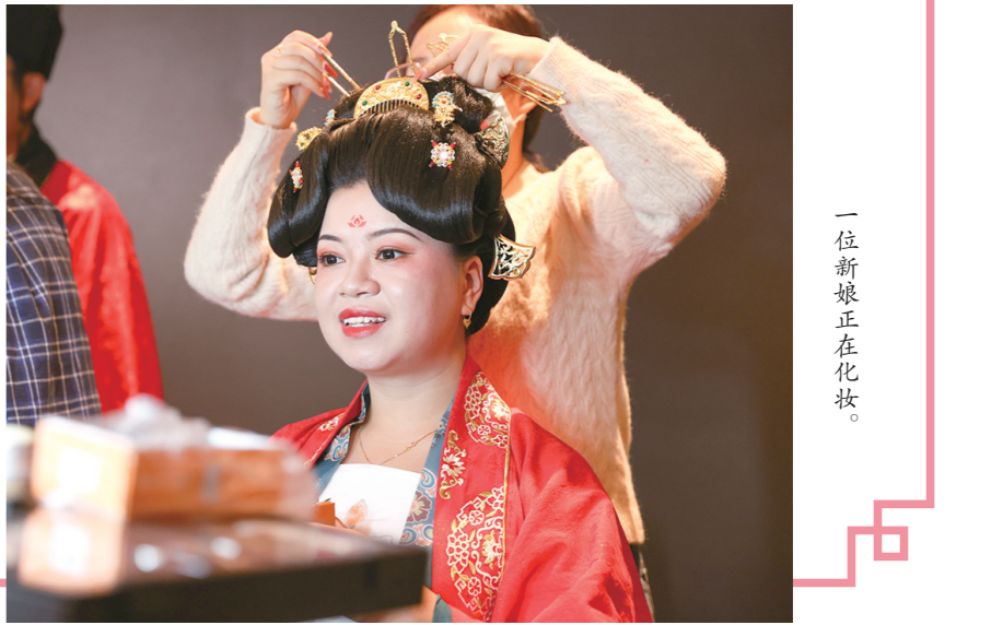
一位新娘正在化妆。

近日,中铁十二局集团有限公司“聚首十三朝 情定十二局”青年职工集体婚礼在西安市昆明池七夕主题公园举行,40对新人