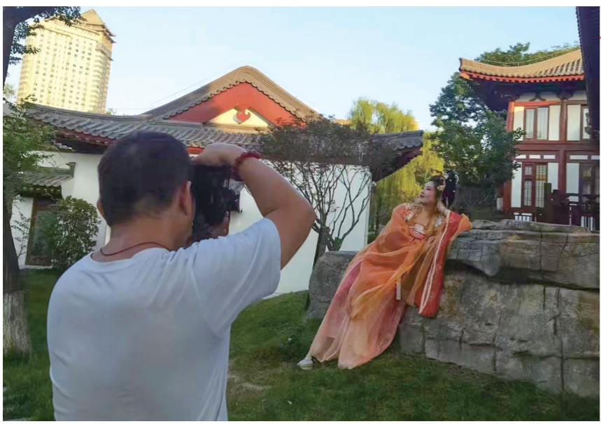
摄影师崔健在西安兴庆公园为客户拍照。