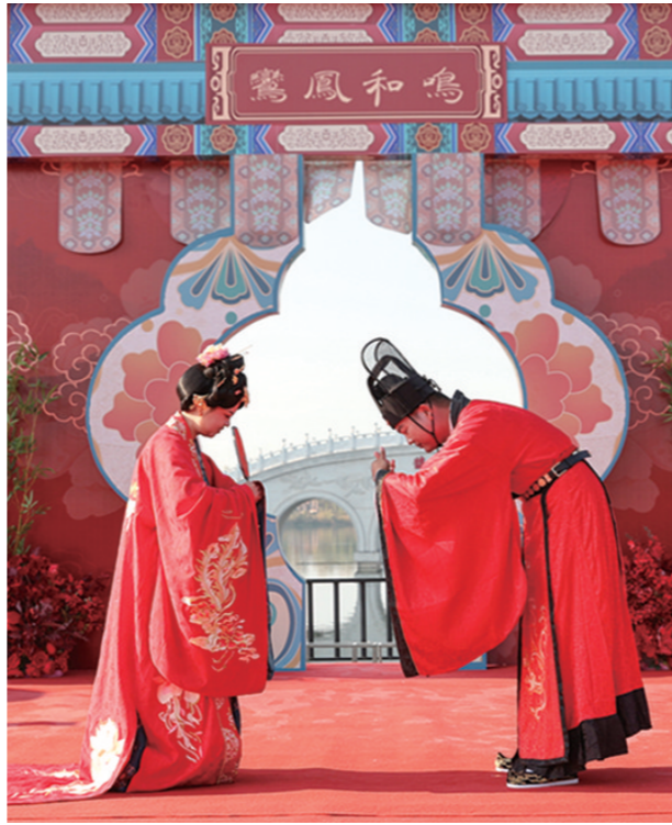
一对新人在鹊桥前对拜。

近日,中铁十二局集团有限公司“聚首十三朝 情定十二局”青年职工集体婚礼在西安市昆明池七夕主题公园举行,40对新人