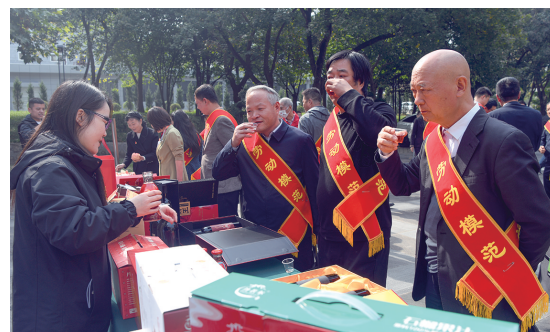
劳模代表现场品鉴石榴饮品。

据了解，此次劳模代表走进临潼区，是主题活动的第二站。之前第一站，劳模代表走进蓝田县，就开展提供免费培训、帮助安置就业等达成共建意向。