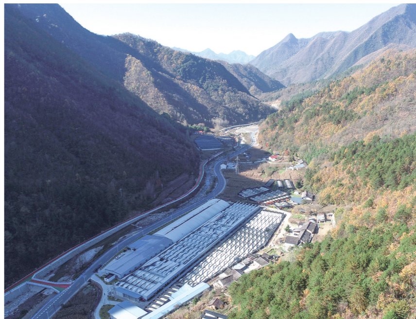
11月17日拍摄的位于宁陕县城关镇的一处香菇种植园区。近年来，该镇建设香菇种植产业园区，带动周边群众就业增收，仅去年产值超1500万元。