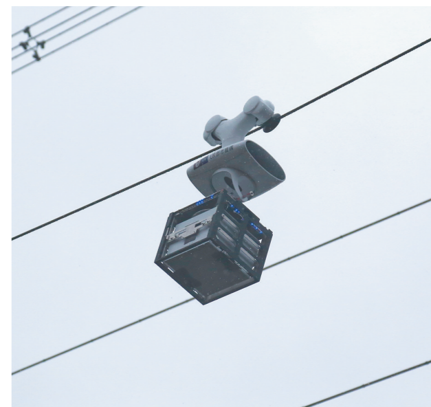
11月17日,在日本川崎市,空中索道机器人在面向媒体的试验说明会上演示运送商品。据悉,这是日本松下等公司探索依靠空中索道运行的机器人配送服务,居民通过专用手机程序订购商品,大约30分钟,空中配送机器人就能把商品送到住宅区内,并自动存入取货柜。居民凭手机程序发送的二维码提取商品。