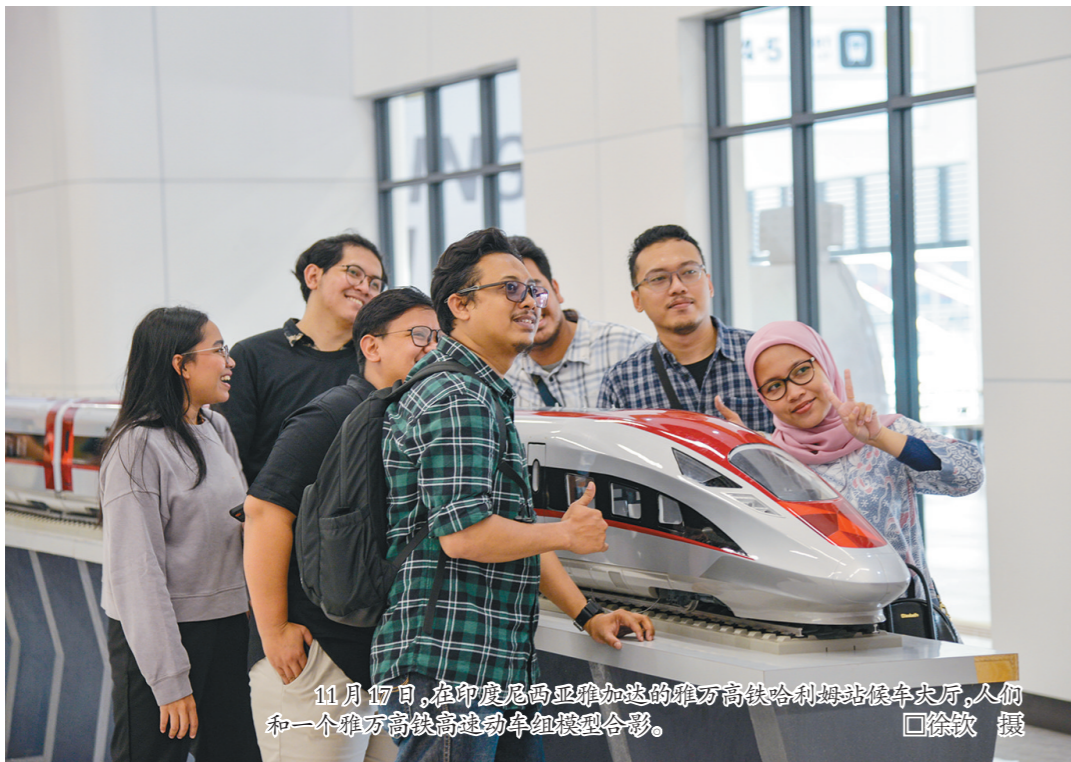
11月17日,在印度尼西亚雅加达的雅万高铁哈利姆站候车大厅,人们和一个雅万高铁动车组模型合影。

对于在印度尼西亚首都雅加达工作的万隆人巴斯·阿赫利·拉马丹来说,雅万高铁的开通完美匹配了他的出行需求。